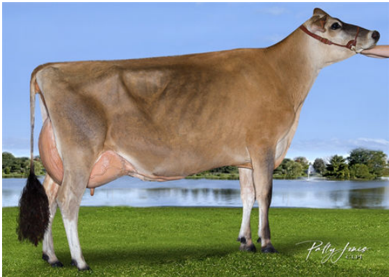
SWISSBELL CHROME OZONE GRANDDAM