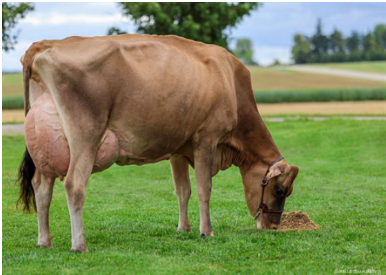
LOTHMANN MAV OPAL DAM